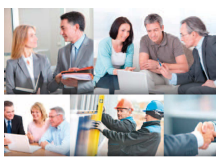
Bilancio di Sostenibilità 2013

In occasione degli incontri di presentazione del Bilancio e del Piano di Sostenibilità , il Gruppo Unipol organizza alcuni momenti di confronto e riflessione su argomenti di particolare attualità. Dopo l'appuntamento torinese, il prossimo è in programma giovedì 19 giugno alle ore 16.30 a Bologna , presso l'Unipol Auditorium (via Stalingrado 37). Tema del pomeriggio “Per uno sviluppo sostenibile. Gli impegni di Unipol a confronto con gli stakeholder” .